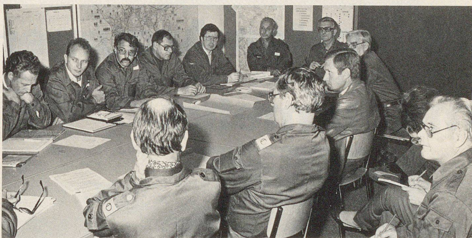
Rapport der Ortsleitung und der Sektorchefs mit einem Mitglied des Stadtrates

Lehrstück oder Examen? – Die Stabsrahmenübung war beides in hohem Masse, nicht allein für den beübten Verband, sondern auch für die Übungsleitung. Es bleibt zu hoffen, dieser kurze Bericht trage Früchte und ermutige eine möglichst grosse Zahl Verantwortlicher im Zivilschutz-Vollzug, sich der Stabsrahmenübung als einer hervorragenden Methode praxisbezogener, auf den Ernstfall ausgerichteter Ausbildung zu bedienen.