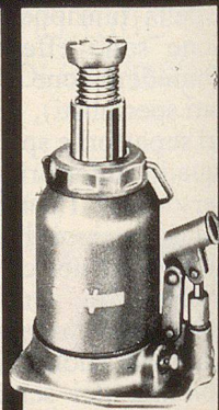
Hydraulischer Wagenheber mit einem Kolben und einer Einstellspindel Hubkräfte: 1,5 - 30 t, 11 Serienmodelle