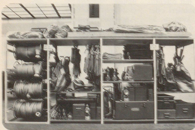
Schränke, Effekten- und Materialgestelle Kombi-Betten als Liege- und Lagergestelle