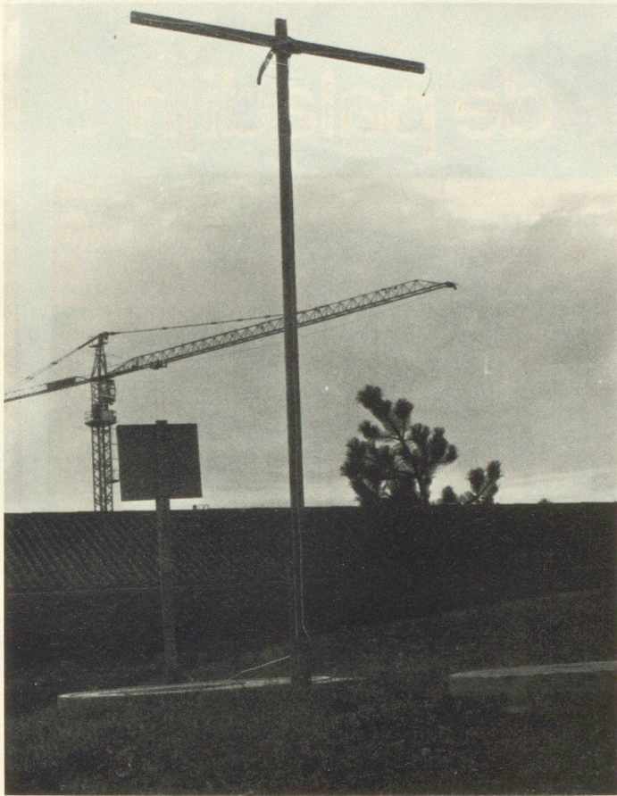
Über dem Schutzraum die laut Schutzraumhandbuch gefeierte Antenne für den sicheren Radioempfang.