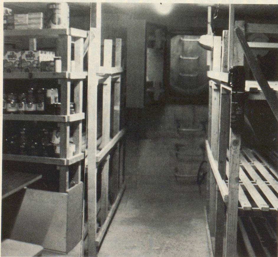
Das Zentrum verfügt auch über einen Übungsschutzraum, in dem auch der Hinweis auf den Überlebensvorrat nicht vergessen wurde.