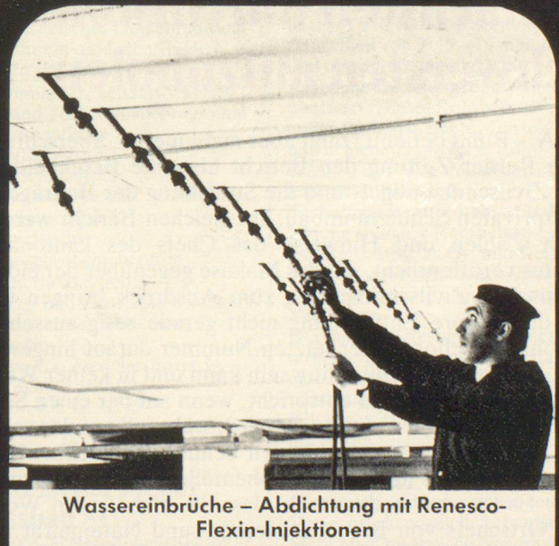
Wassereintritte – Abdichtung mit Renesco-Flexin-Injektionen