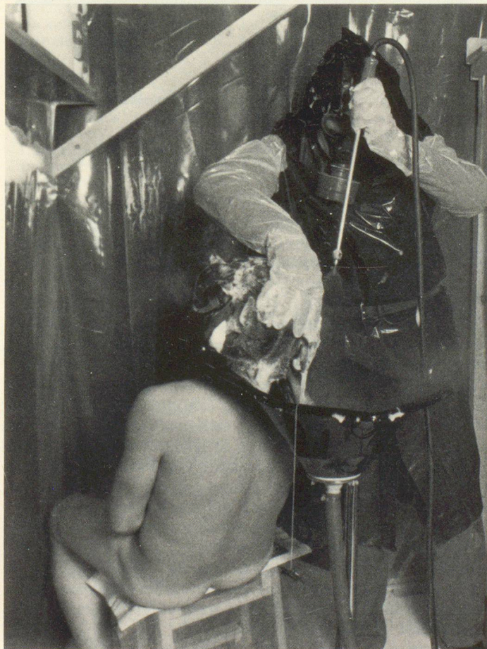
Schnappschuss von der praktischen Demonstration einer behelfsmässigen Dekontaminationsstelle.