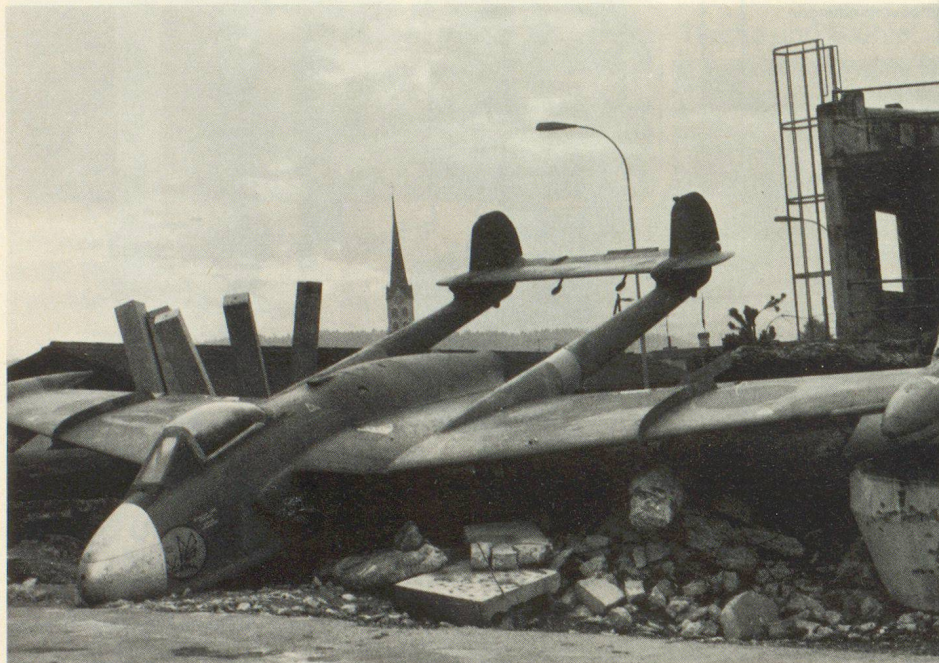
Blick über einen Teil der Übungspiste mit einem der beiden Flugzeuge.