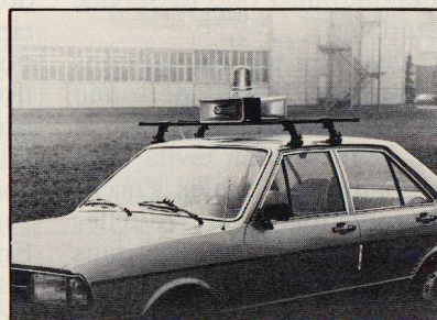
Alarmeinheit für den mobilen Einsatz Mit 2 oder 4 Lautsprechern, mit oder ohne Blaulicht, für 4 verschiedene Alarmsignale und Sprachdurchsage, für Kernkraftwerke, Zivilschutz, Feuerwehr, Polizei und Armee.

Ericsson Alarmsysteme: 20 Jahre Erfahrung für die Sicherheit