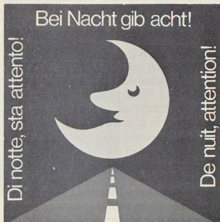
Motto 1980 des Verkehrserziehungsprogramms der Armee

Aufklärung, Orientierung und Werbung für den Zivilschutz ist angesichts der unsicheren Weltlage gerade heute von entscheidender Bedeutung. Es sollte daher auch nicht die kleinste Möglichkeit ausgelassen werden, in diesem Sinne initiativ und aktiv zu sein. Dazu können auch die Gemeinden und ihre Zivilschutzstellen beitragen. Als Beispiel von vielen anderen zeigen wir hier den in diesem Sinne gestalteten Briefumschlag der Zivilschutzstelle Luterbach SO.