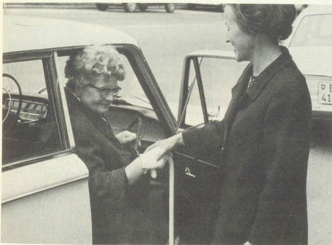
Autodienst des SRK: Rotkreuz- Autofahrerin Service automobile de la CRS: conductrice Croix-Rouge