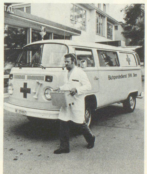
Blutspendedienst Service de transfusion de sang