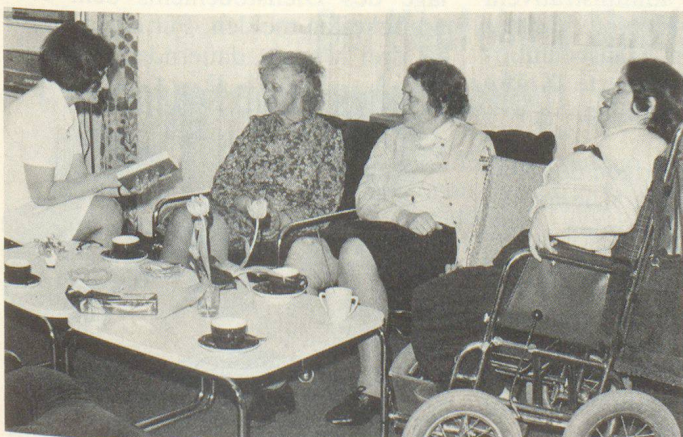
Betreuung Behinderte, Betagte Soins aux invalides

Wenn Sie mehr über das SRK wissen möchten, wenden Sie sich an: