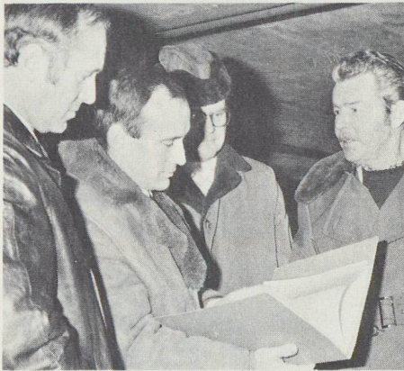
Blick ins Drehbuch, das genaue Übungsprogramm. Die Delegierten des Bundesamtes für Zivilschutz zeigten sich darob befriedigt.