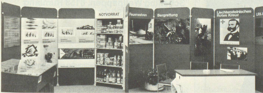
Der anschaulich gestaltete Stand des Amtes für Zivilschutz und Landesversorgung.