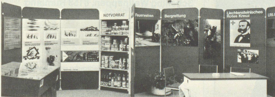
Der anschaulich gestaltete Stand des Amtes für Zivilschutz und Landesversorgung.