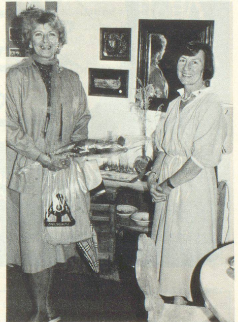
Gina, Fürstin von Liechtenstein, Präsidentin des Liechtensteinischen Roten Kreuzes, hat sich am Zivilschutz-Informationsstand mit Prospekten eingedeckt.