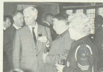
Schnappschuss von einer Studienreise nach England.