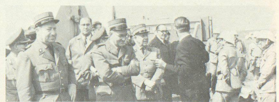
Im Raume Tübingen wurden 1963 Vorführungen des Bundesluftschutzverbandes, des technischen Hilfswerkes der Bundeswehr im Katastropheneinsatz besichtigt.