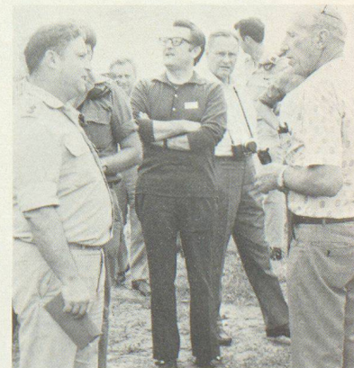
Eindrücklich waren auch die Studienreisen nach Israel, verbunden mit Vorführungen und Besichtigungen. Auf dem Bild rechts erkennen Sie Regierungsrat Bolfig (Schwyz) und Regierungsrat Stucki (Zürich).