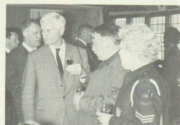
Schnappschuss von einer Studienreise nach England.