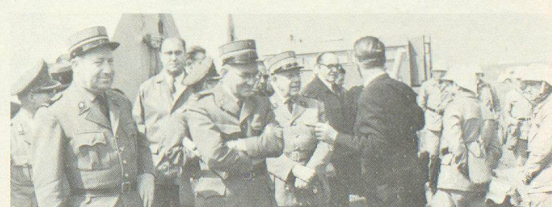
Im Raume Tübingen wurden 1963 Vorführungen des Bundesluftschutzverbandes, des technischen Hilfswerkes der Bundeswehr im Katastropheneinsatz besichtigt.