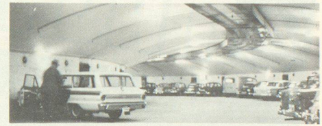
Vier Besuche in Schweden führten zu neuen Erkenntnissen. In Stockholm wurde auch einer der zahlreichen, als Garage benutzten Schutzräume besichtigt.