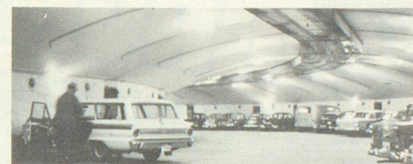
Vier Besuche in Schweden führten zu neuen Erkenntnissen. In Stockholm wurde auch einer der zahlreichen, als Garage benutzten Schutzräume besichtigt.