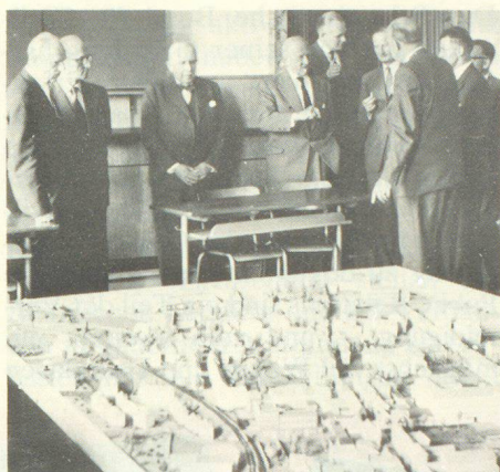
Mehrmals wurden in den Jahren 1956 bis 1963 Studienreisen in das Ausbildungsgelände des Technischen Hilfswerks im Ahrtal (BRD) durchgeführt. Auf der ersten Reise war auch alt Bundesrat von Steiger dabei.