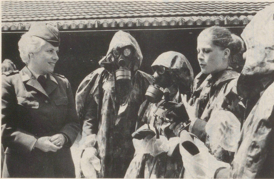
Auch der AC-Schutz gehört zur Ausbildung unserer FHD.