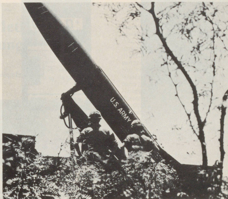
Abb. 3. Dieses amerikanische Raketensystem «Lance» wird in den Nato-Staaten seit 1973 eingesetzt. Die Reichweite liegt zwischen 8 und 120 km. «Lance» kann mit konventionellem oder nuklearem Sprengkopf verwendet werden; es ist für den Einsatz von Neutronenwaffen vorgesehen.

– Bei mit bisherigen taktischen Nuklearwaffen vergleichbaren Energieäquivalenten ergeben sich bei Neutronenwaffen wesentlich grössere Schadenradien durch Initialstrahlung gegen gepanzerte und mechanisierte Verbände. Die Vergrösserung beträgt rund 50 % im Radius bzw. 125 % in