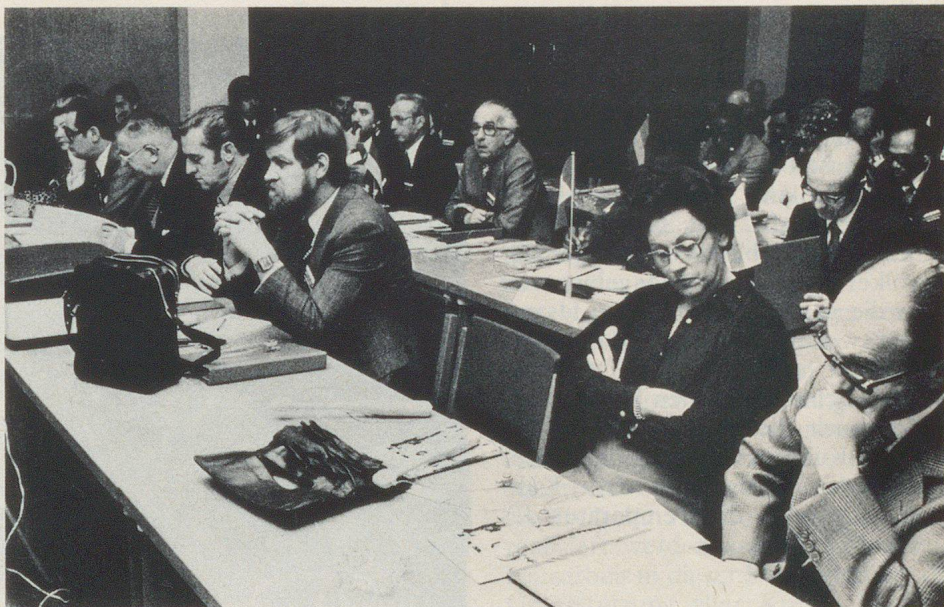
Die Schweizer Delegation an der ZS-Konferenz in Helsinki.

Im Rahmen der Informationstagung vermittelte der Generaldirektor des Zivilschutzes in Gabun ein Exposé