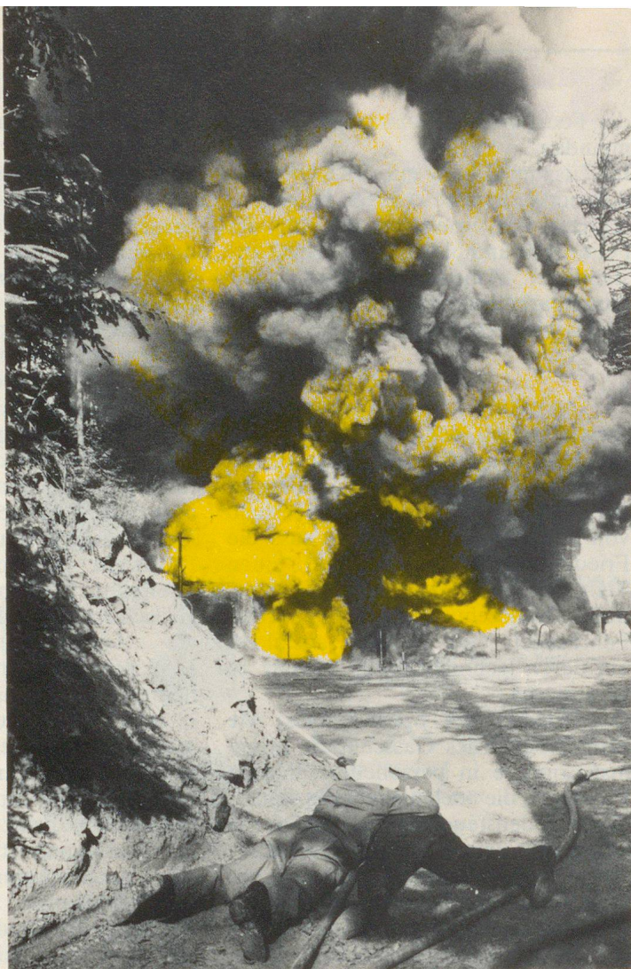
Bekämpfung eines Benzinbrandes von 6000 Litern in Bern