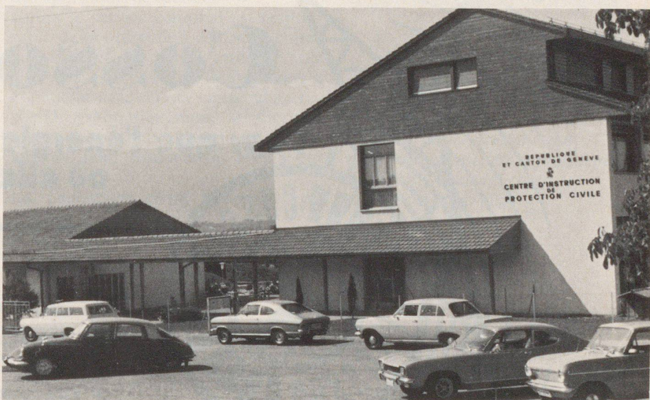
Le premier centre de formation de la protection civile a été créé à Bernex, en tant que prototype.

Bien que son organisation ne soit pas terminée, la protection civile genevoise est opérationnelle depuis 10 ans,