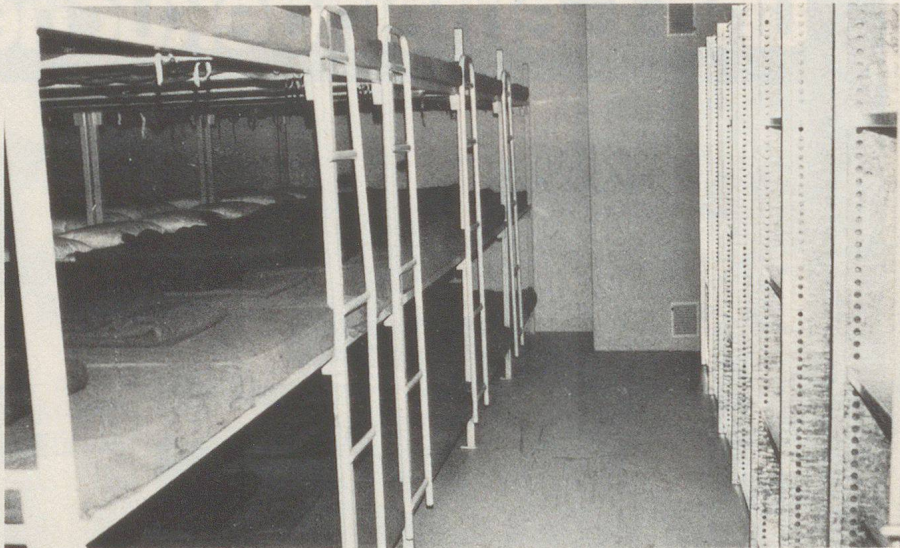
Sguard illas localiteds da durmir

la protecziun civila, ils pumpiers, il militer e l'uffizi da fabrica.