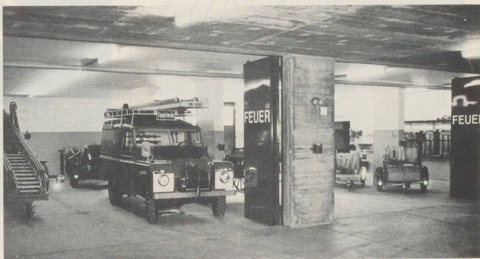
Eir pel materiel dals pumpiers sto uossa a dispusiziun ün local adatto e drizzo aint fich pratic.

Ido Ferrari, büro d'architettura, Puntraschigna