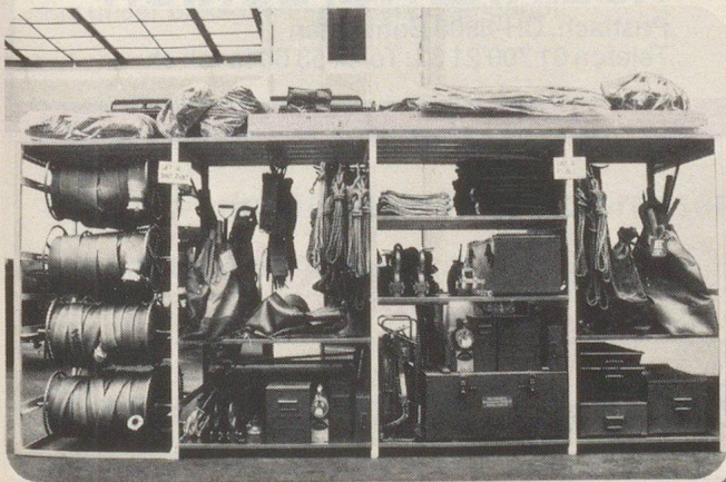
Armoires, étagères pour matériel et pour effets.

Lits à usages multiples. Utilisation comme lits ou comme casiers de stockage.