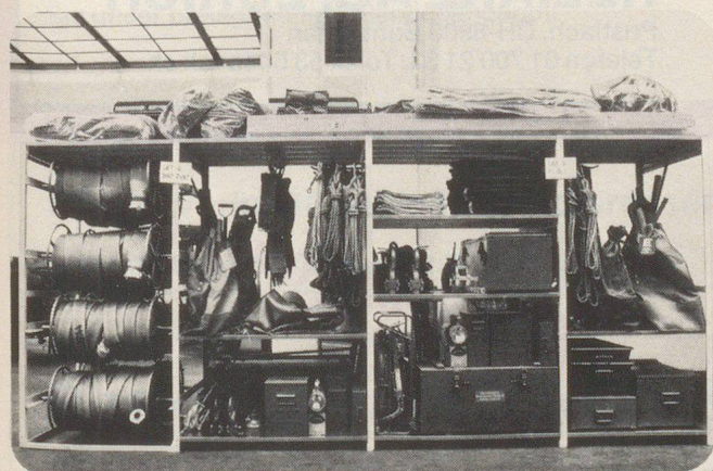
Armoires, étagères pour matériel et pour effets.