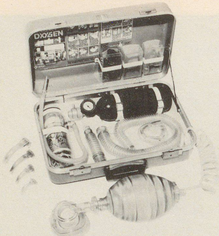
Erste-Hilfe-Koffer Modell Modulaide Oxygen Jet