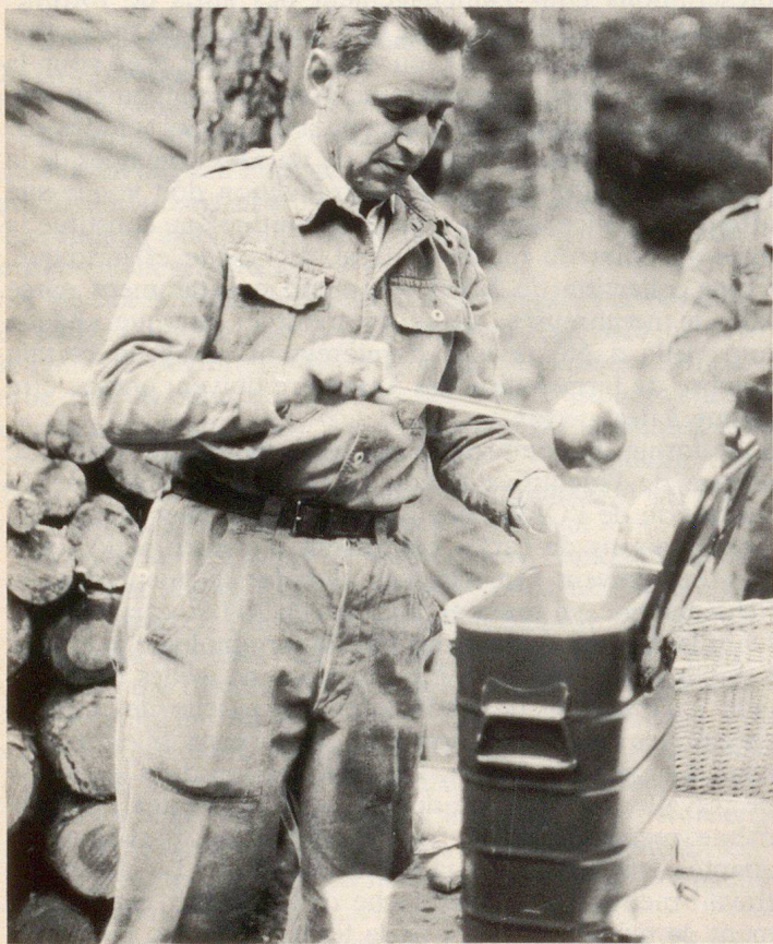
Wohlverdiente Teepause nach schwerer Arbeit Une pause bien méritée après un dur labeur Una pausa ben meritata dopo un duro lavoro

Au cours d'une séance, qui a eu lieu assez récemment entre des représentants de l'Office fédéral et des membres du service sanitaire coordonné (DMF, Service de santé), il s'est trouvé que parmi 80 expressions définies provisoirement on n'arrivait à discuter et à fixer définitivement que quelques-unes en allemand et en français, parce qu'il s'agissait d'une matière très complexe qui concerne la protection civile autant que l'armée. Cela prouve combien de tels contacts avec le service sanitaire coordonné et, d'ailleurs, également avec d'autres services du Département militaire sont nécessaires pour obtenir la concordance de la terminologie dans tous les domaines de la défense générale.