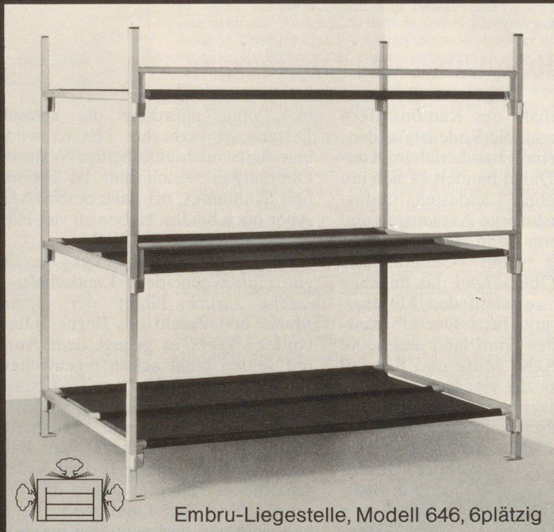
Embru-Liegestelle, Modell 646, 6plätzig

Embru ist Generalunternehmer für die Lieferung von über 20000 Liegestellen, samt Einrichtung der notwendigen Zusatzräume, wie Block-Leitungen, Quartier-Leitungen, Toilettenanlagen usw.