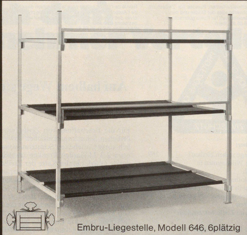
Embru-Liegestelle, Modell 646, 6plätzig

Embru ist Generalunternehmer für die Lieferung von über 20000 Liegestellen, samt Einrichtung der notwendigen Zusatzräume, wie Block-Leitungen, Quartier-Leitungen, Toilettenanlagen usw.