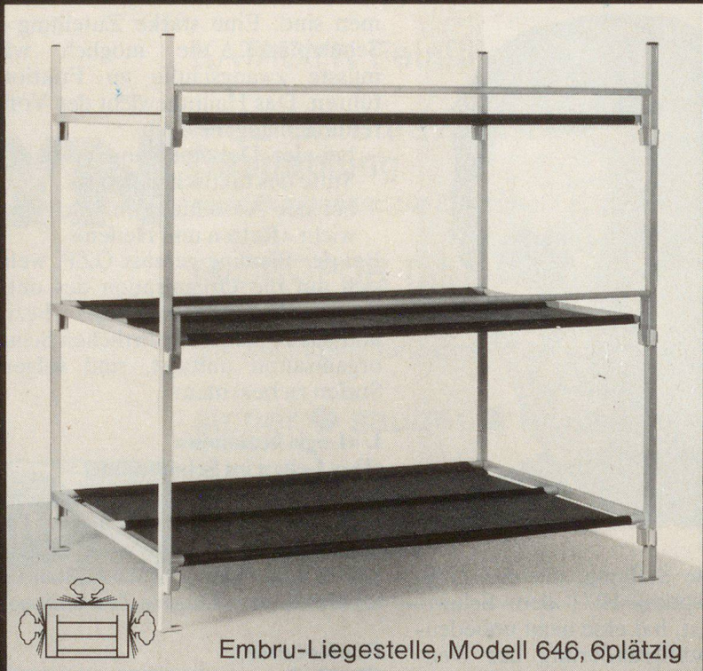
Embru-Liegestelle, Modell 646, 6plätzig

Embru ist Generalunternehmer für die Lieferung von über 20000 Liegestellen, samt Einrichtung der notwendigen Zusatzräume, wie Block-Leitungen, Quartier-Leitungen, Toilettenanlagen usw.