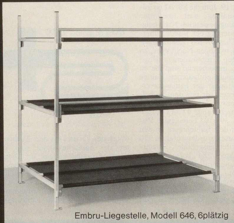
Embru-Liegestelle, Modell 646, 6plätzig

Embru ist Generalunternehmer für die Lieferung von über 20000 Liegestellen, samt Einrichtung der notwendigen Zusatzräume, wie Block-Leitungen, Quartier-Leitungen, Toilettenanlagen usw.