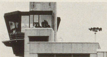
Foto: Neuer Beobachtungsturm Flughafen-Feuerwehr Kloten; rechts davon die Ericsson-Tyfon-Alarmanlage.

sun avaunt maun in grandas massas. Cha ellas nu vegnan in adöver in cas da guerras, es probabel be uschè lönch cha l'üna u l'otra part da quels chi's cumbattan retegna l'adöver da quist'arma scu unica pussibilted per cas d'imbarraz. Dalander essans nus uschè inavaunt cha stuvains integrer tuots lös d'abiter illa protecziun cumplessiva. Las armas tendschan uschè dalöntscha cha eir lur acziun lontaun davent da la Svizra po chaschuner razs radioactivs chi nu's ferman neir brich a nos cunfin ed eir brich als cunfins cumünels u rivand tar nossas muntagnas. In quist cas vainsa da fägir in noss locals da protecziun e da rester lo uschè lönch fin cha'l prievel es passo. Quist po durer tuot seguond fin a 15 dis. Per proteger a minchün stuvainsa fabricher eir illas vschinaunchas las pü pitschnas lös da protecziun, siand eir la populaziun da quels lös degna da protecziun scu quella da vschinaunchas pü grandas e da citeds. Quist fat motivescha cha s'obliescha a mincha lö da's proveder cun locals da protecziun. (Protr.)