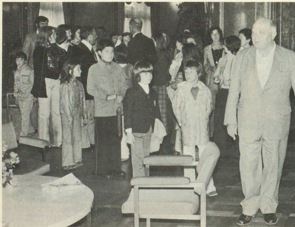
Dans les salles sacro-saintes du Palais fédéral