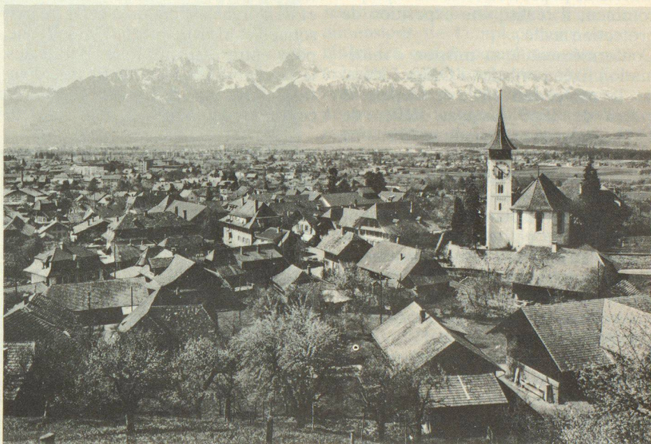
Steffisbourg avec la chaîne du Stockhorn

Le programme prévoit une série d'exposés sur la protection civile dans le cadre de la défense générale, ainsi que plusieurs visites d'installations à Steffisbourg, Thoune, Spiez/Gesigen, Berne, Ostermundigen, Meiringen et Sempach. La journée du 1er octobre sera particulièrement intéressante, car