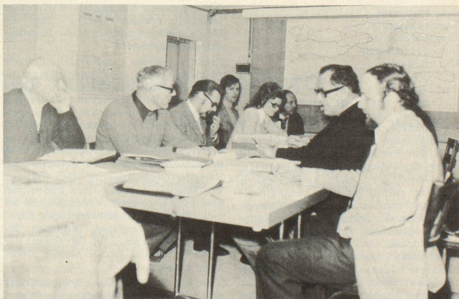
Mit derselben Ernsthaftigkeit wurden auch in diesem Sektorkommandoposten die gestellten Aufgaben bewältigt