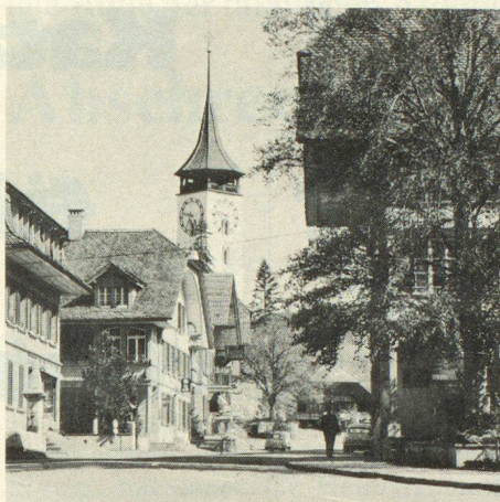
Steffisburg, ein altes währschaftes Berner Dorf, das bevölkerungsmässig eine Kleinstadt geworden ist

Das Tagungsprogramm umfasst eingehende Orientierungen über den Zivil-