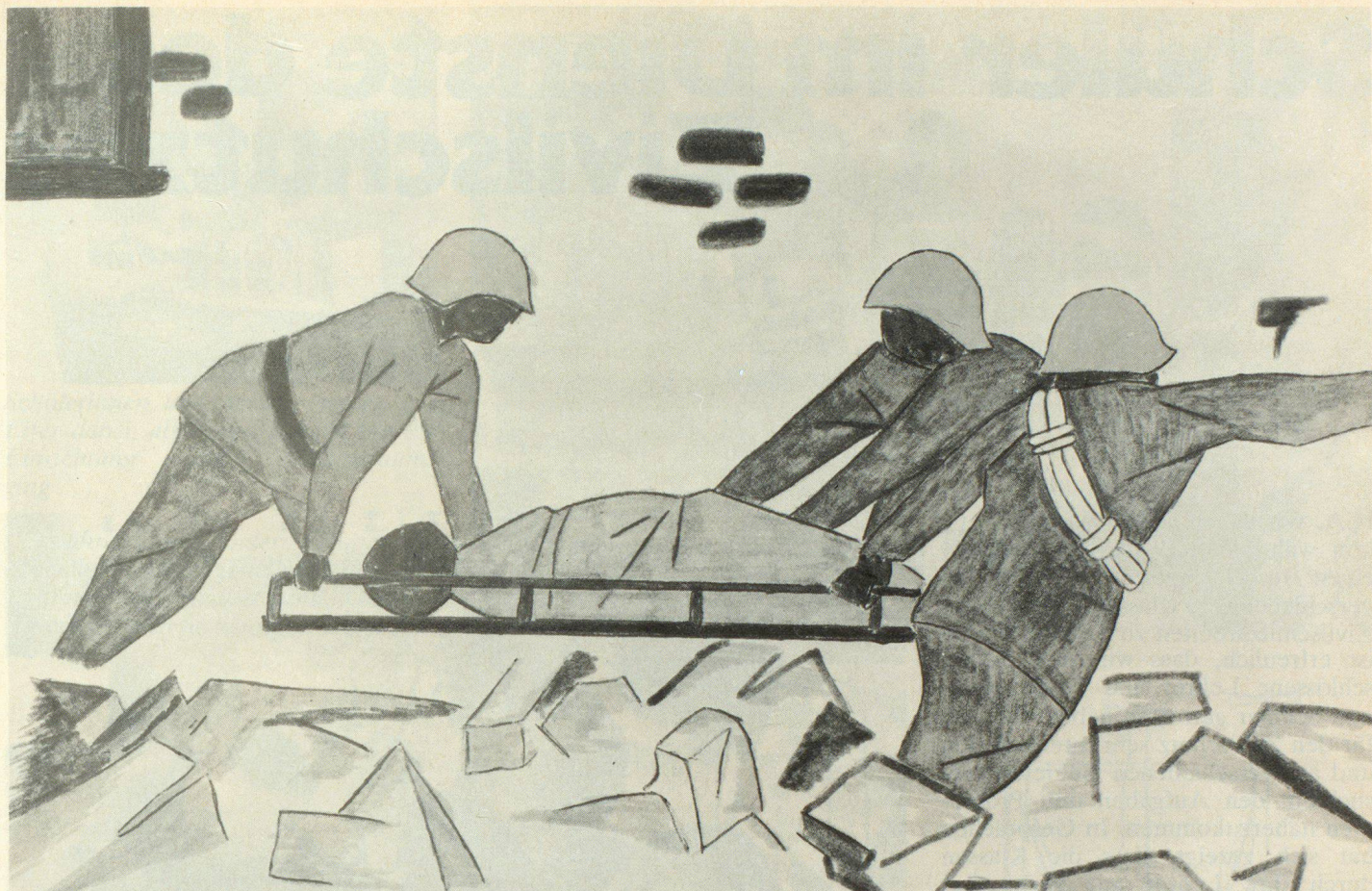
Rey-Mermet Blaise, Monthey, Jahrgang 1963