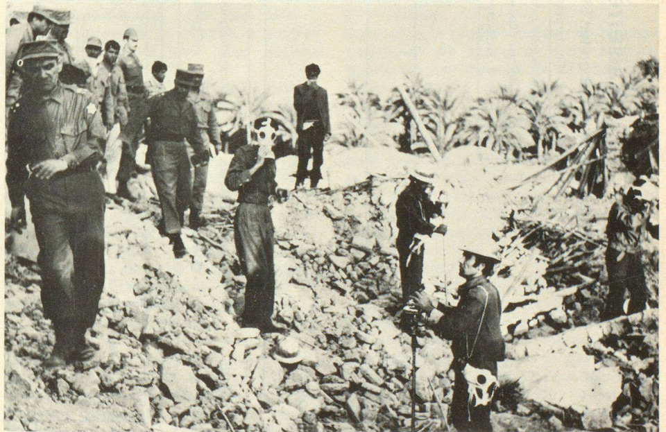
Einsatz von Ortungsgeräten bei der Suche nach unter Gebäudetrümmern verschütteten Dorfbewohnern

8. Bau von Aus- und Weiterbildungsstätten für das Instruktionspersonal, das obere Kader und die vollamtlich tätigen Berufsleute der Zivilschutzzeinheiten.