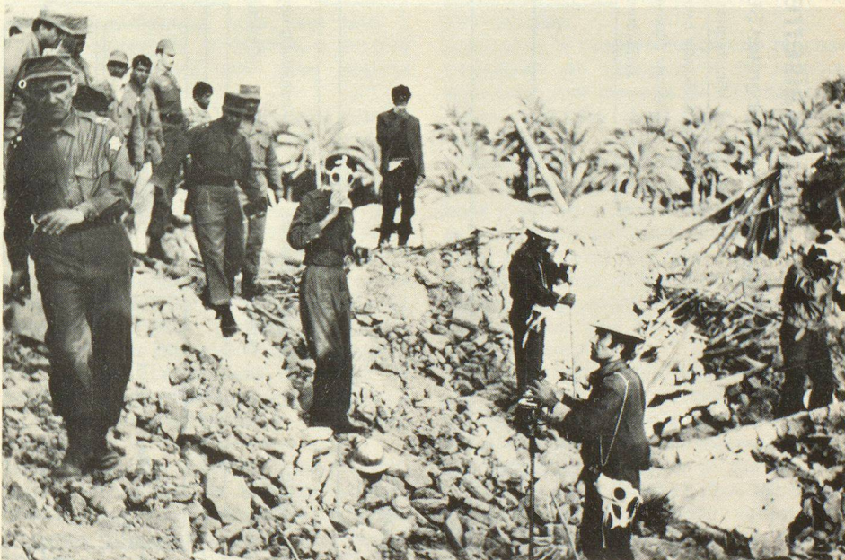
Einsatz von Ortungsgeräten bei der Suche nach unter Gebäudetrümmern verschütteten Dorfbewohnern

8. Bau von Aus- und Weiterbildungsstätten für das Instruktionspersonal, das obere Kader und die vollamtlich tätigen Berufsleute der Zivilschutzseinheiten.