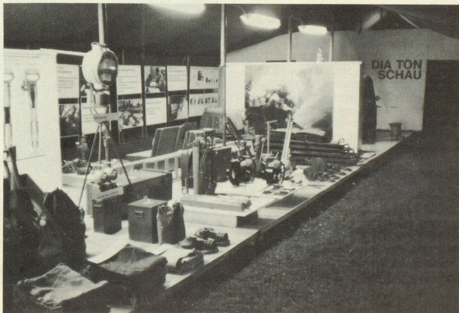
Blick in das Innere des Ausstellungszeltes, in dem ein Rundgang in die Bedeutung des Zivilschutzes einführt und auch einen Eindruck des modernen Materials vermittelt