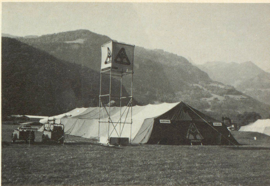
Die Waffenschau, durchweg in Zelten untergebracht, wurde durch diesen Turm mit den vier ZS-Signetten überragt, der weithin den Standort der Zivilschutzschau fixierte und als Wegweiser wirkte

schutz aufgebaut wurde. Es war eine gute Idee, dass am ersten Tag auch die Walenstadter Schulklassen durch die Ausstellung geführt wurden, um neben der militärischen Landesverteidigung einen Begriff vom Zivilschutz im Rahmen der Gesamtverteidigung zu erhalten. Es sind vor allem solche kleinere Ausstellungen im regionalen Rahmen, die für den Zivilschutz beste Informationsmöglichkeiten bringen, wenn alle Möglichkeiten genutzt werden, die sich in der Region anbieten. sbz