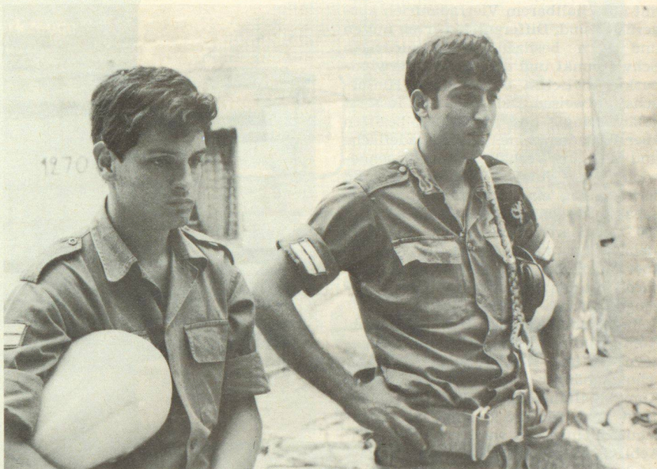
Die Soldaten des israelischen Zivilschutzes, der HAGA, empfangen uns gerne zu einem weiteren Studienbesuch

Abstecher nach Eilat am Roten Meer erweitert wird, ist erschienen. Kosten: Alles inbegriffen 2143.— Fr. Für diese Reise haben sich schon viele Interessenten gemeldet. Weitere Interessenten werden gebeten, sich umgehend beim Zentralsekretariat des SBZ, Schwarztorstrasse 56, 3007 Bern , schriftlich zu melden, damit sie in die Teilnehmerliste aufgenommen werden können. Das Programm wird allen Interessenten mit einem Meldeformular zur definitiven Anmeldung zugestellt.