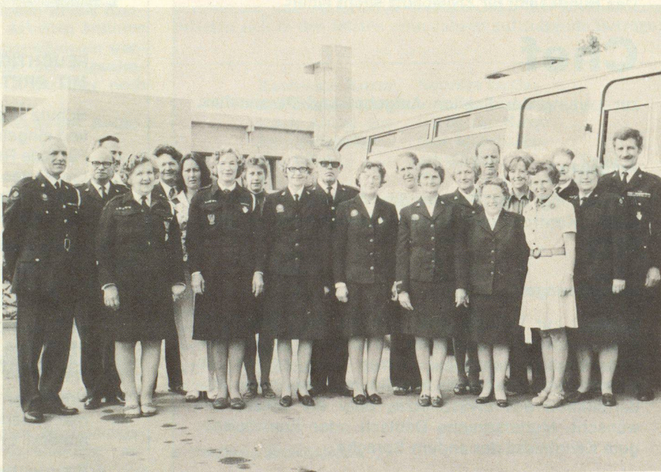
Die englischen ZS-Gäste mit ihren Betreuern in Steffisburg

Dank dem guten Wetter und der Umsicht der Gastgeber in Steffisburg wurde die Reise zu einem grossen Erfolg. Besonders begeistert äusserten sich die Gäste auch über Organisation, Aufbau und Einrichtungen des Schweizer Zivilschutzes, was nach ihrer Ansicht zum besten Standard gehört, was sie in den letzten Jahren auf ihren Reisen durch Europa gesehen haben.