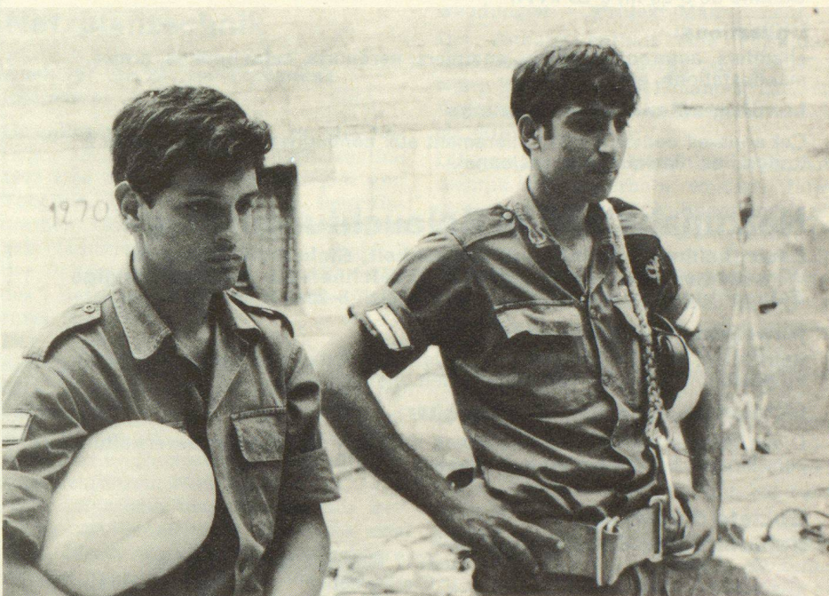
Die Soldaten des israelischen Zivilschutzes, der HAGA, empfangen uns gerne zu einem weiteren Studienbesuch