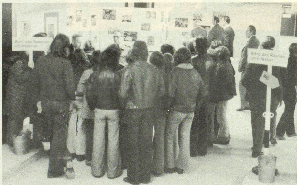
Es war erfreulich, dass auch die Jugend den Tag der offenen Tür in Winterthur benützte, um sich über den Zivilschutz als Glied unserer Gesamtverteidigung orientieren zu lassen.

Wir werden in der kommenden Mainnummer unserer Zeitschrift, deren Schwerpunkt auf das Leben im Schutzraum ausgerichtet ist, eingehend über das Beispiel Winterthur berichten und uns auch mit der Organisation für das Leben im Schutzraum befassen.