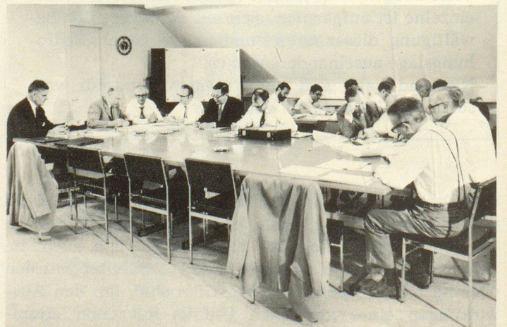
Le comité d'alarme de la Commission fédérale de la radioactivité (CFR) est un état-major de crise dont les membres peuvent se réunir dans les plus brefs délais.