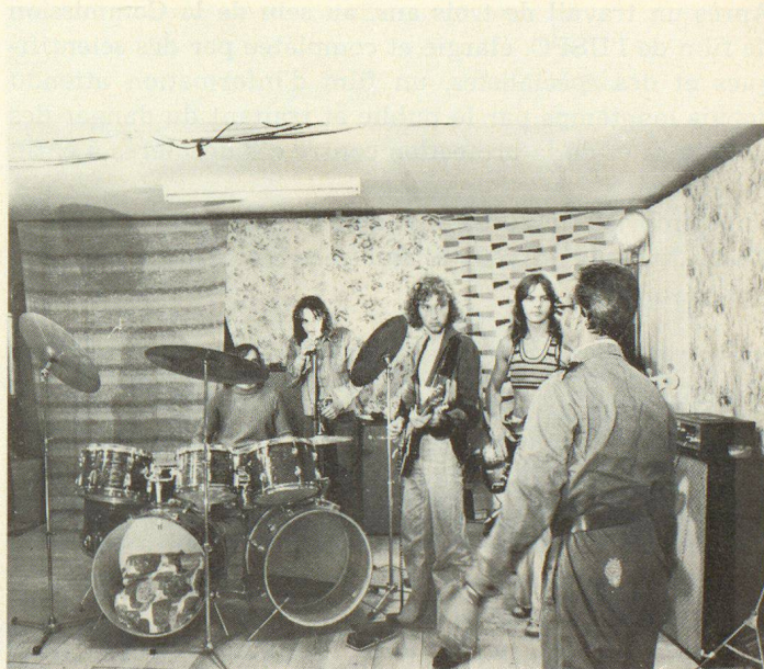
Ein Schutzraum, der an eine Jugendgruppe vermietet ist, muss beim Alarm geräumt und eingerichtet werden.

Farbfilm in Eastman Color, Gesamtlänge 35 mm: 685 m, Gesamtlänge 16 mm: 277 m, Vorführungsdauer: 25'30".