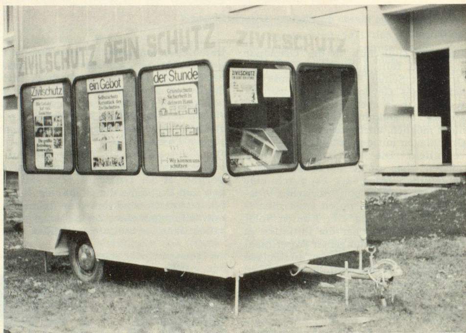
Der Informationswagen von aussen

Am Wagen sind an jeder Seite einschlägige Tafeln über Zivilschutz angebracht; so sieht man an einer Seite eine Kleinausstellung «Zivilschutz, ein Gebot der Stunde», die auf drei Tafeln das gesamte Problem von der Ersten Hilfe über baulichen Zivilschutz und atomare Gefährdung zeigt und auf der anderen Seite die Darstellung des Warn- und Alarmsystems, den Zivilschutz als einen Teil der umfassenden Landesverteidigung und eine Zusammenfassung des Bevorratungsproblems dargestellt.