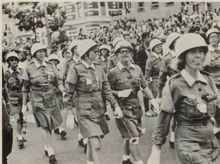
Gruppe des dänischen Zivilschutzes am grossen Einmarsch am vierten und letzten Marschtag, als die Strecke durch ein Spalier von rund einer halben Million Zuschauern nach Nijmegen hineinführte

ihr Land und ihre Organisation Ehre einlegen. Mit den zahlreichen Gruppen aus Armee, Polizei, Feuerwehren, Sport-, Wander- und Schützenvereinen, die jedes Jahr das grosse Kontingent der Schweizer in Nijmegen bilden, wären auch Marschgruppen des Zivilschutzes unseres Landes herzlich willkommen. Nächstes Jahr wird der Marsch vom 16. bis 19. Juli durchgeführt. Weitere Auskünfte gibt die Redaktion gerne.