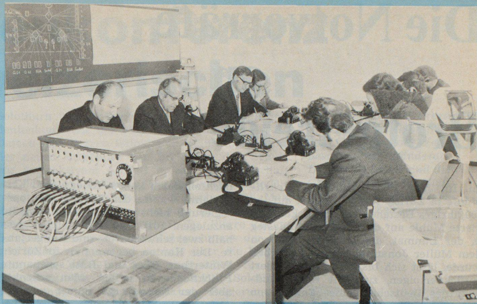
Schnappschuss von einem Kurs im Nachrichten- und Uebermittlungsdienst