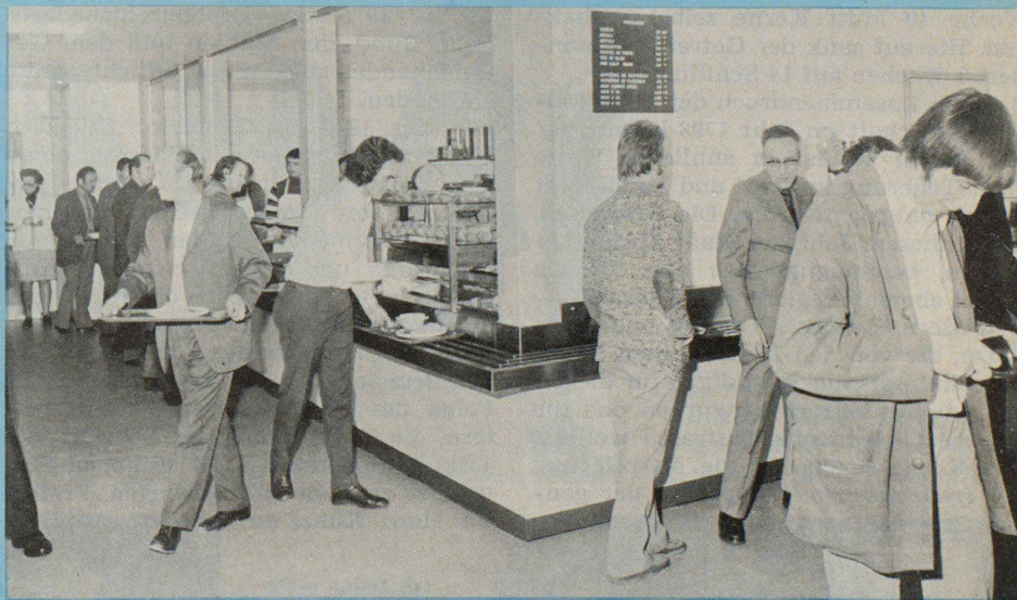
Blick in die praktisch ausgestaltete Kantine mit Selbstbedienung