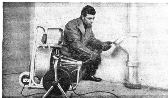
Entstopfer Typ A20 für Rohre von 50–300 mm \varnothing und bis zu 30 m Länge.

Für Rohre über 300 mm \varnothing lohnt sich der Einsatz unserer «Atümat»-Hochdruckreinigungsgeräte.