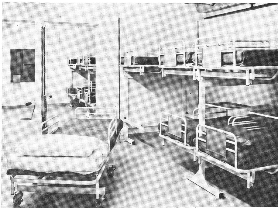
Bettenraum einer Sanitätshilfsstelle des Zivilschutzes