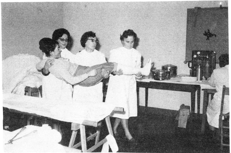
Der Frauen wartet vor allem im Sanitätsdienst des Zivilschutzes eine wichtige Aufgabe

Nachdem im vergangenen Jahr mit recht grossem Erfolg ein Naturschutzjahr durchgeführt wurde und heute viel vom Kulturgüterschutz gesprochen wird, wäre es an der Zeit, auch einmal ein Menschenschutzjahr zu propagieren. Der Gedanke des totalen Sanitätsdienstes muss in die Köpfe der Menschen eindringen. Die Ideen popularisiert werden. Die Mitmenschen müssen informiert und zum Mitmachen angeregt werden. Totaler Sanitätsdienst ist für uns alle zur Daueraufgabe von heute, morgen und übermorgen geworden. Wir müssen ein Volk von Samaritern werden.