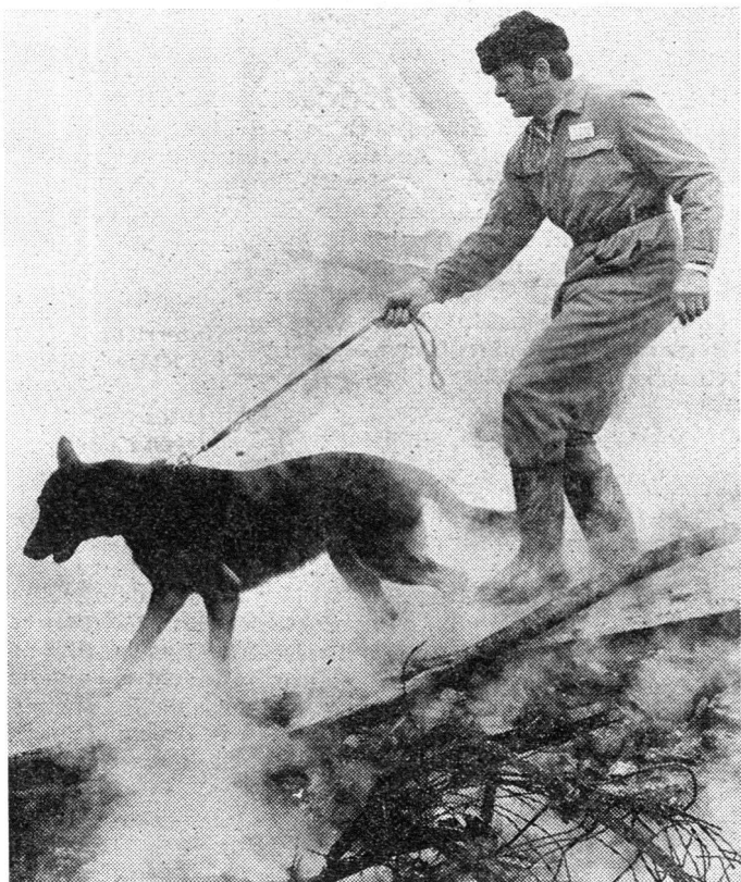
Ein Katastrophenhund bei Rauch, Lärm und unwegsamen Trümmern im Einsatz