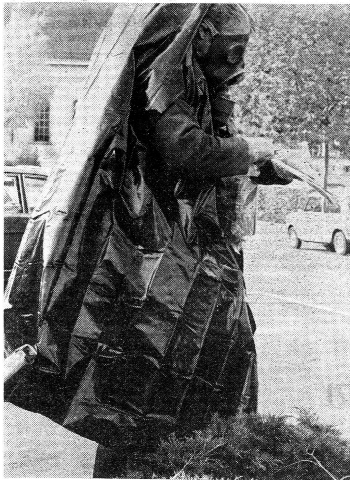
A-Spürer misst, indem er sich dreht, die Verstrahlung