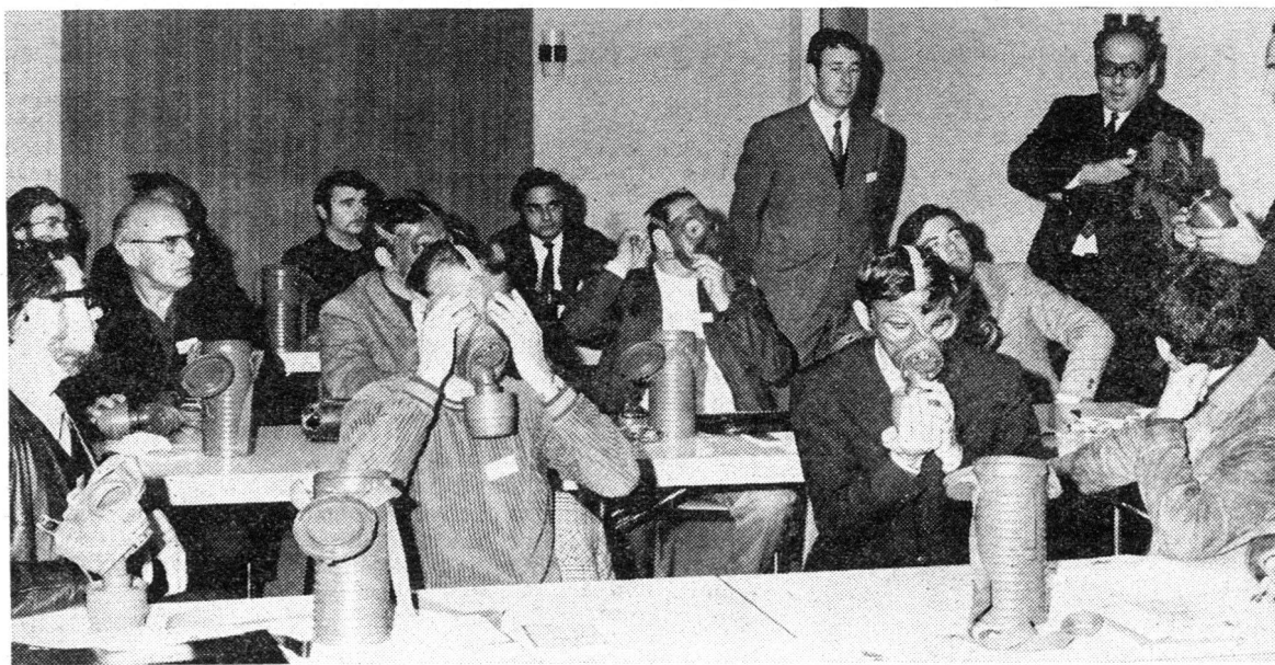
Interkantonaler Ausbildungskurs für A-Spürer in Horn