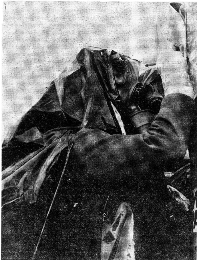
Führung des Messprotokolls beim Messposten