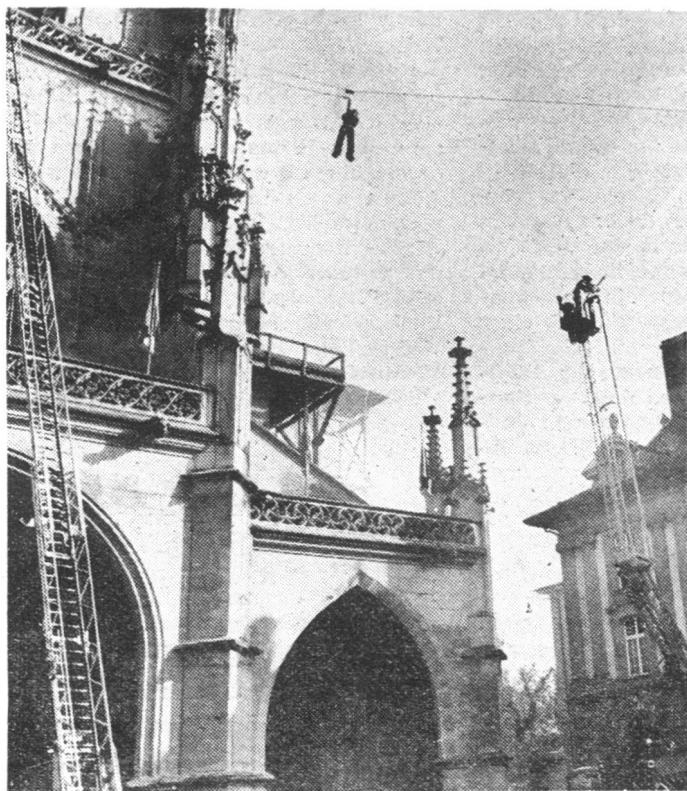
Rettung aus luftiger Höhe mit Seilbahn und Leitern