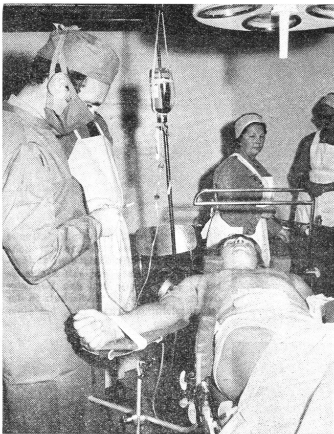
In der Sanitätshilfsstelle Glockenthal (Steffisburg), welche die «Verletzten» aufnahm, waren alle Vorbereitungen getroffen worden, um ernstfallmässig auch schwerste Wunden zu behandeln