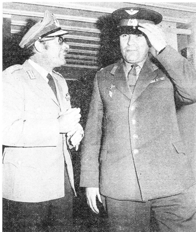
Mit grossem Interesse folgten die in Bern akkreditierten Militärattachés der Uebung, nachdem sie vorher Gelegenheit zum Besuch bei den Luftschutztruppen erhalten hatten. Hier unterhalten sich die Militärattachés der Bundesrepublik Deutschland und der Sowjetunion über ihre Eindrücke