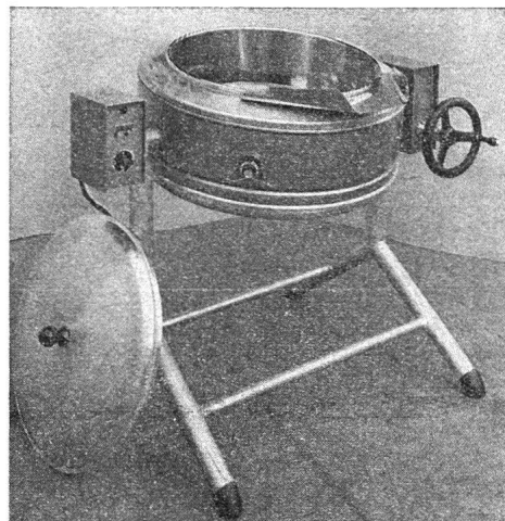
Bratpfanne Typ «Cantine»