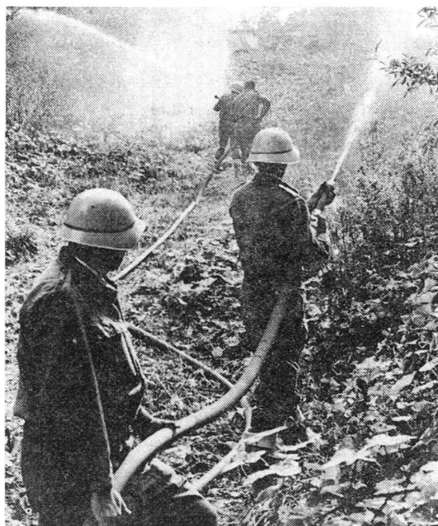
Sapeurs-pompiers de guerre en action