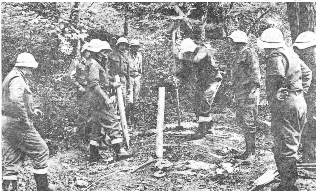
Préparatifs pour amarrage