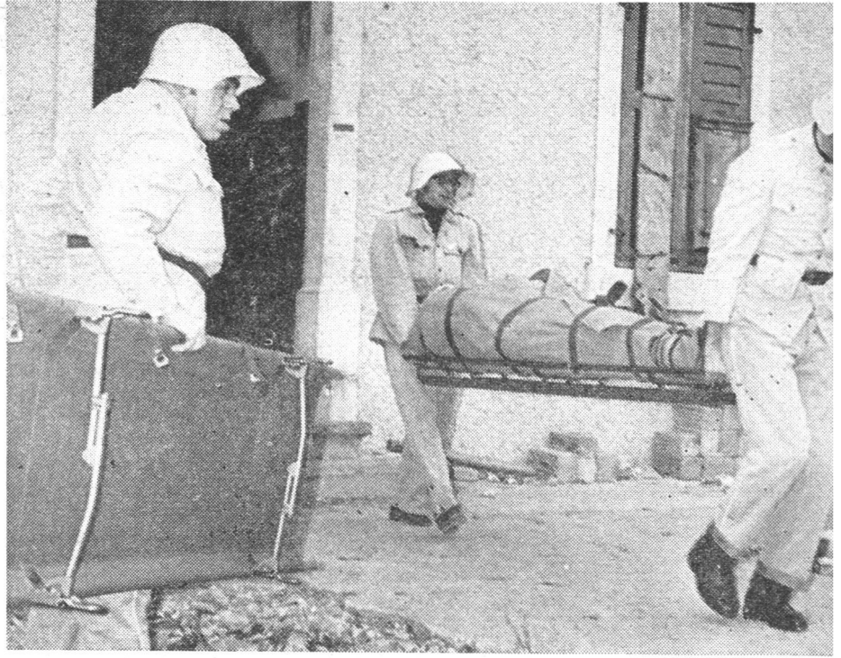
Hand in Hand arbeiteten Frauen und Männer zusammen, um die geborgenen Verletzten behutsam und rasch unter erschwerten Bedingungen in ärztliche Obhut zu bringen

Der Zivilschutz der Stadt Biel beschloss im Dezember letzten Jahres einen Sanitätskurs auf dem Gelände einer Abbruchstelle an der Bözingerstrasse durch eine realistische Uebung ab. Der gezeigte Einsatz belegte eindrücklich den Erfolg der Kursarbeit, die Frauen und Männern im Dienste praktischer Nächstenhilfe zu einem Erlebnis wurde. Zahlreichen Vertretern der Behörden und interessierten Instanzen, die der interessant angelegten Uebung in ihren einzelnen Phasen folgten, wurde durch diesen praktischen Anschauungsunterricht gezeigt, dass Zivilschutz auch Katastrophenschutz ist. ZSI