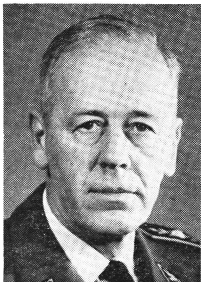
Oberstbrigadier Charles Folletête †

Ei drova denton aunc gronds sforzs e dabia orientaziun per che nies Cantun seigi en cass da basegns preparaus e stgis avunda da proteger nossa populaziun civila sufficientamein.