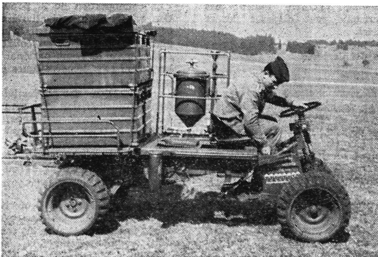
BERKEFELD -Trinkwasseraufbereiter AQUA-SERVER, 2 m 3 /h, aufmontiert auf Kraka, konnte bei dem Fallschirmabwurf in Altenstadt am 28./29. März 1968 unmittelbar nach der Landung in voller Funktion eingesetzt werden

Schulter an Schulter mit dem Zivilschutz und den für Wasserfragen zuständigen Instanzen für die zeitverzugslose Verwirklichung der Notwasserversorgung zu kämpfen, ist die harte Forderung eines lebenswichtigen Teilaspekts unserer Gesamtverteidigung .